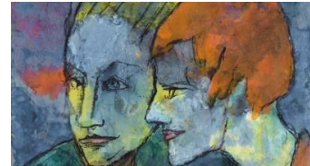
(Expresionismo) / Alemán