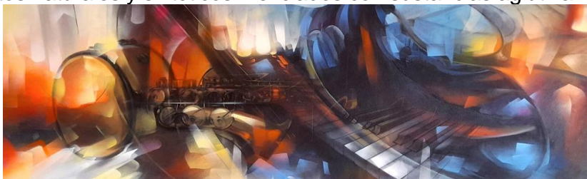
(Abstracto figurativo) Fernelis Frreras

Cuando hablamos de la pintura o de artes pictóricas nos referimos a una forma artística que busca representar la realidad gráficamente, empleando para ello formas y colores sobre una superficie, a partir de pigmentos naturales y sintéticos mezclados con sustancias aglutinantes ( pinturas ).