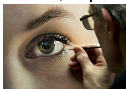
Hiperrealismo o foto realismo