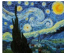
(Impresionismo) Vincent van Gogh