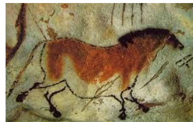
Descubiertos en Rumania, Europa Central