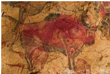
Descubiertos en Rumania, Europa Central

La pintura inicia como técnica de expresión humana hace 32.000 años, con las primeras pinturas rupestres en las paredes de las cavernas que habitaba el hombre primitivo. Empleaba para ello sangre y otras sustancias, que en lo sucesivo serían reemplazadas paulatinamente por aceites y pigmentos.